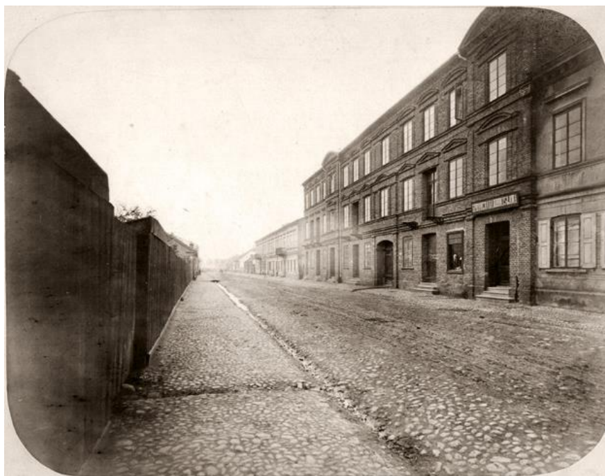
Ilustracja 2 Widok skrzydła od strony ul. Jaracza, 1975