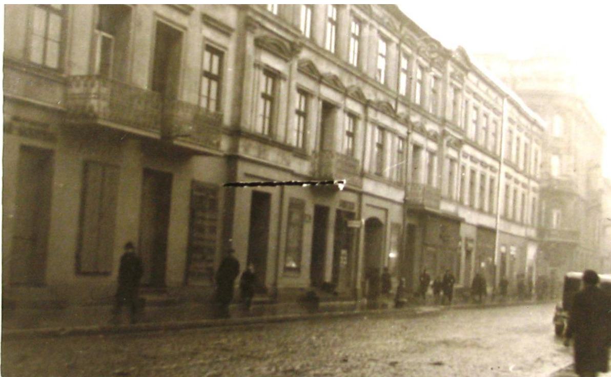
Ilustracja 5 Widok kamienicy od strony ul. Jaracza, 1939 r.

„Przygotowanie i opracowanie dokumentacji dla przedsięwzięcia pn. „Rewitalizacja Obszarowa Centrum Łodzi (Projekt 9)” z zakresu rewitalizacji obszarów miejskich, planowanej do dofinansowania w ramach perspektywy finansowej 2021-2027”