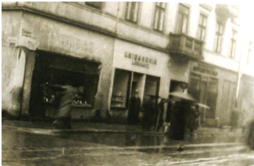
Ilustracja 6 Widok kamienicy od strony ul. Jaracza, 1939 r.