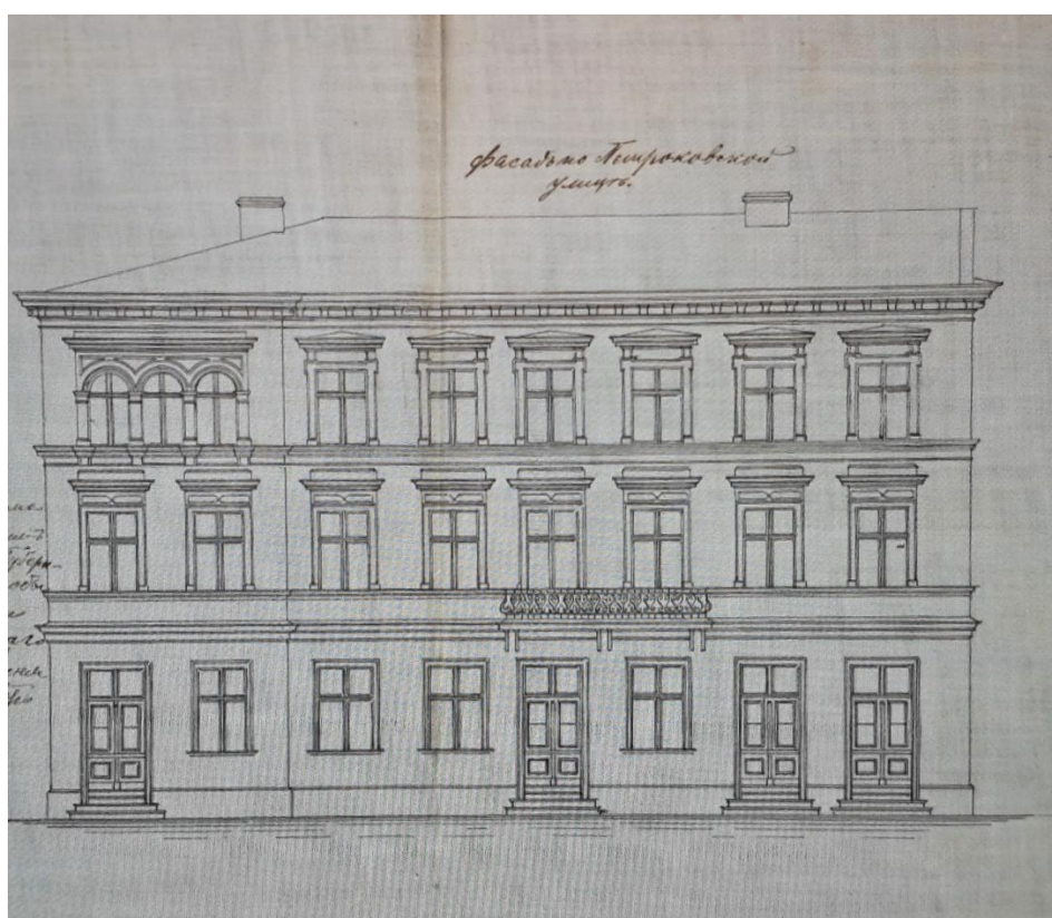
Ilustracja 4 Projekt podwyższenia budynku narożnego o jedną kondygnację- widok od ul. Piotrkowskiej.