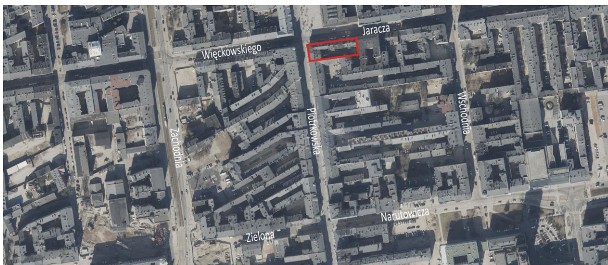
Ilustracja 1 Lokalizacja obiektu położonego przy ul. Piotrkowskiej 34 / Jaracza 1, Źródło: opracowanie własne na podstawie ortofotomapy

Nieruchomość znajduje się na terenie miasta Łodzi, w województwie łódzkim, w kwartale ulic: Piotrkowska, Jaracza, Wschodnia, Narutowicza, pod adresami Piotrkowska 34 / Jaracza 1. Obiekt zlokalizowany jest na działce nr 358, obręb S-1 (nr GUS 106105_9.0001.358).